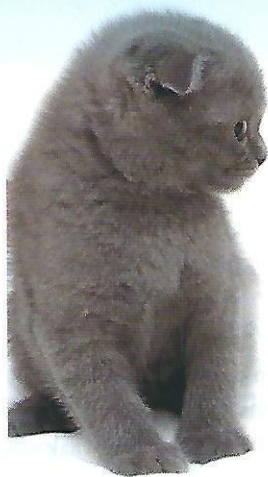
Laat een kat op eigen tempo naar de kleine komen als hij dat wil

‘Om te voorkomen dat de wieg als nieuw slaapplekje wordt geconfisqueerd, kun je er wat opgeblazen ballonnen in leggen’